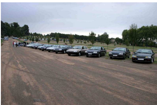
Rencontre à l'occasion du 2è anniversaire