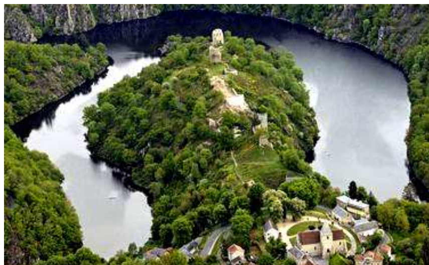
Crozant les Ruines